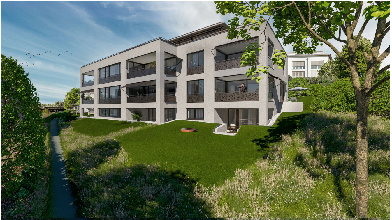
ein modernes Mehrfamilienhaus mit einem grünen Rasen vor einem großen Haus