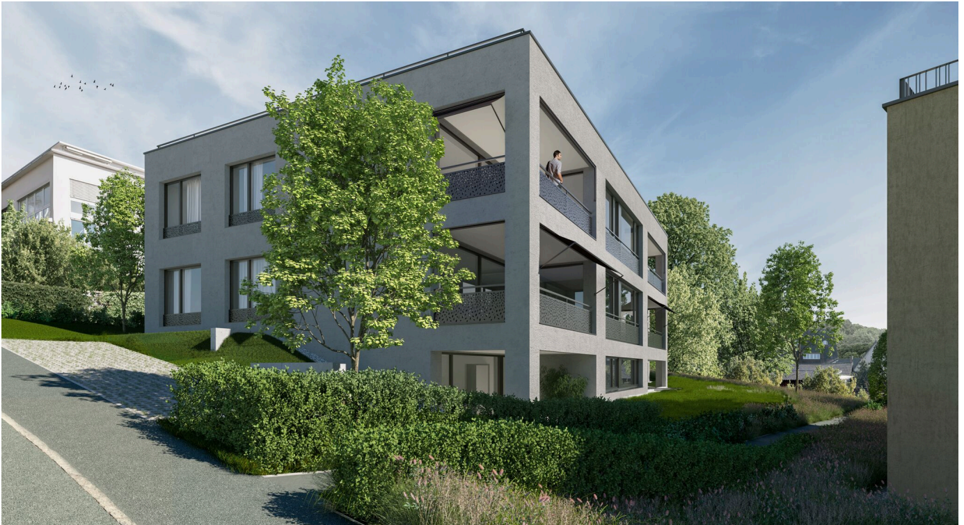
moderne Wohngebäude, die neue Wohnungen beherbergen werden