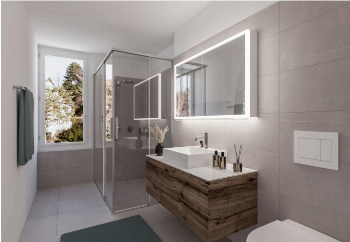
ein modernes Badezimmer mit Toilette, Waschbecken, Dusche und Spiegel

CH-4103 Bottmingen | Ruchholzstr. | CHF 1'885'000.-