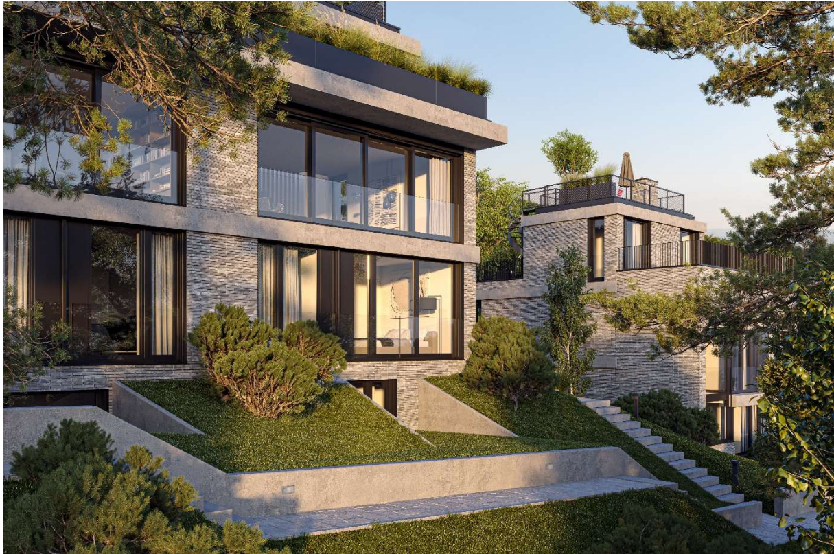
KURUMI – Westfassaden von Haus 1, 2 und 3. Bei Haus 1 (links) und Haus 2 (mittig) sind die Schlafzimmer im Erdgeschoss. Im Obergeschoss ist der Wohnbereich mit oder ohne Küche. Das Attikageschoss ist hier vom Pflanzentrog verdeckt. Rechts im Bild ist das doppelstöckige Erdgeschoss und das Attikageschoss von Haus 3 sichtbar.