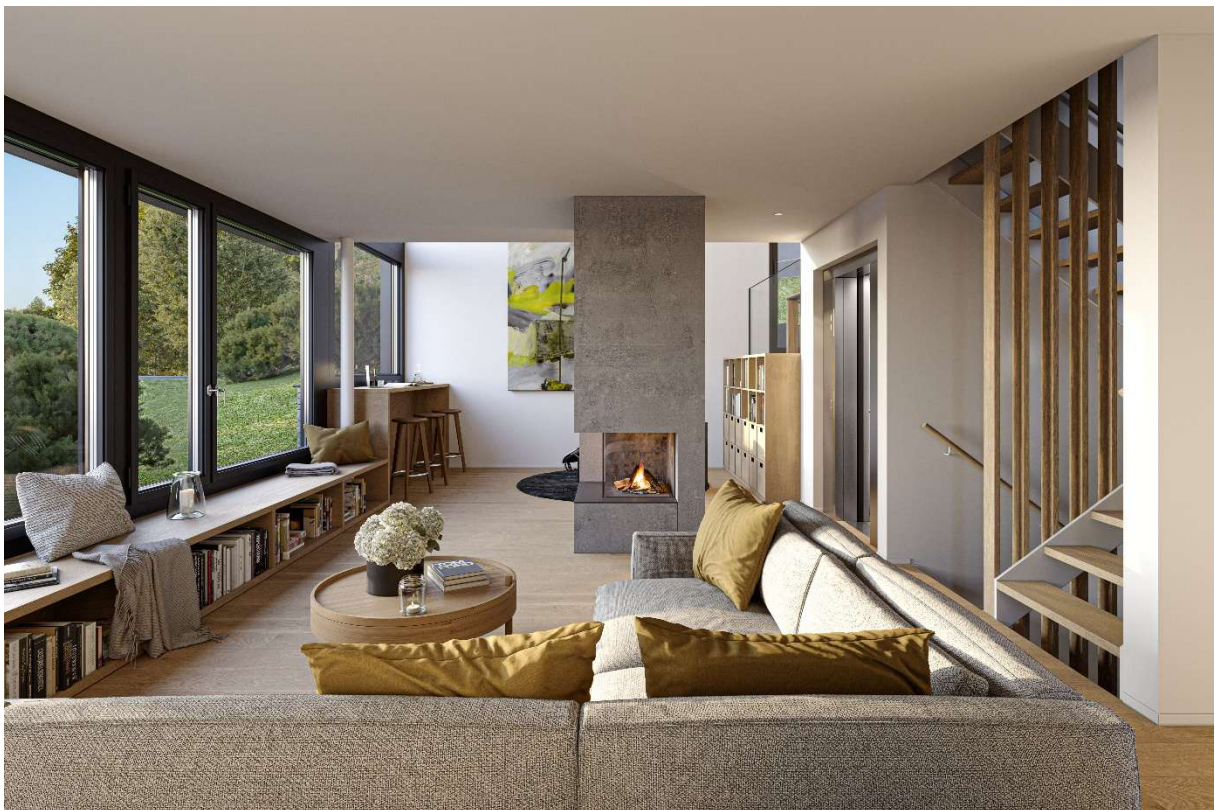
KURUMI - Haus 3 – im Erdgeschoss