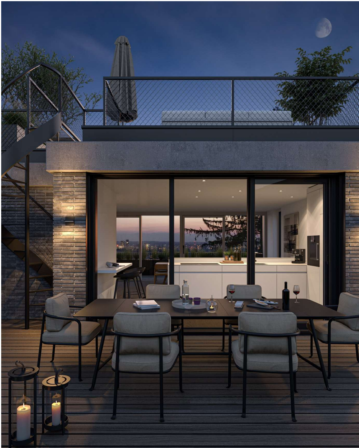
KURUMI - Haus 1 – im Attikageschoss mit Blick in die Küche und auf das begehbare Dach mit Garten und Photovoltaik