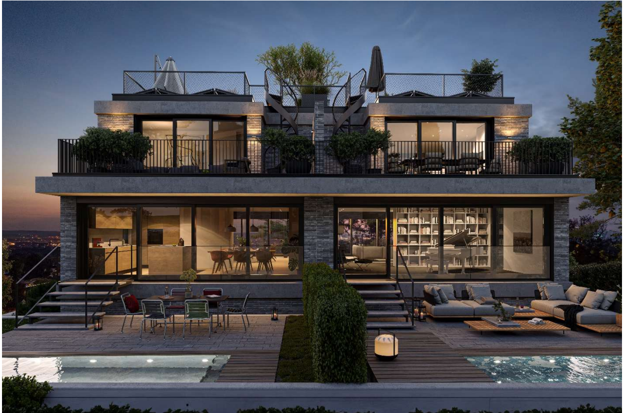
KURUMI - Haus 2 (links) und Haus 1 (rechts)